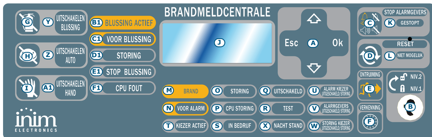
Afbeelding 1 - Frontpaneel van de centrale