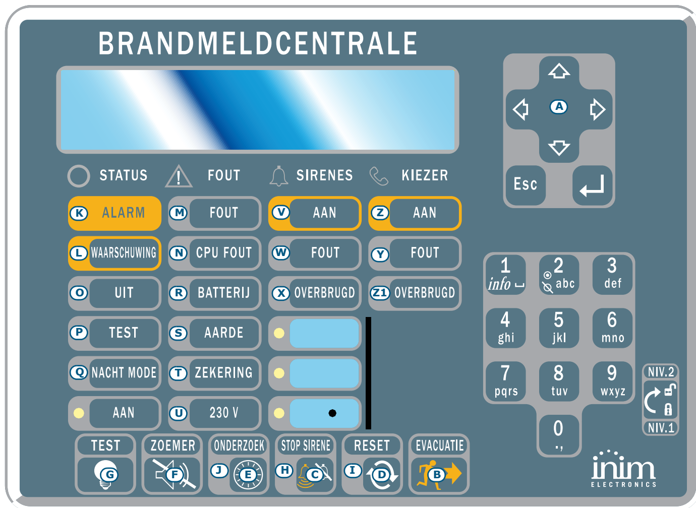
Afbeelding 2 - Vooraanzicht van het herhaalpaneel

Er kunnen tot vier herhaalpanelen worden aangesloten, die een replica geven van de informatie op het paneel van de centrale en van waaruit u toegang heeft tot alle functies voorbehouden voor gebruikers van niveau 1 en 2 (weergave en doorlopen van actieve gebeurtenissen, reset, muting enz., het is NIET mogelijk om naar het hoofdmenu te gaan).