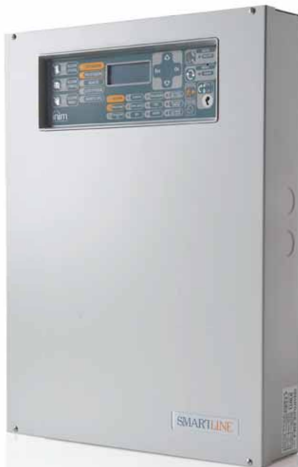
SmartLine Conventionele brandmeldcentrale en bluscentrale Gebruikershandleiding